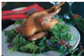
まるごとローストチキンきのこのリゾット詰め2,500円(写真はイメージ)。

年末は美味しいお酒と料理で盛り上がる！忘年会はおひとり様3,500円より。クリスマスディナープラン(12/25まで)は青森・短角牛がメインのコース料理でおひとり様4,200円。ホームパーティ派には、クリスマスオードブル&ローストチキンはいかが？詳細はお問い合わせください。※全て税別、要予約。数に限りあり。