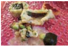
写真はイメージ。揚げた米ナスには、サザエの肝のピュレ。トマトのピュレを添えて。

梅雨の雨を飲んで美味しくなる鰻(はも)。京都の祇園祭には欠かせない高級魚として知られる食材ですね。長崎・戸石産の鰻が出荷されることも多く、なかなか良い物を押さえるのがこの時期難しいそうです。当店でも入荷したときのみのご提供になりますので、確認されてご来店ください。